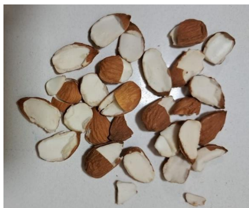
Generado en escandallo.