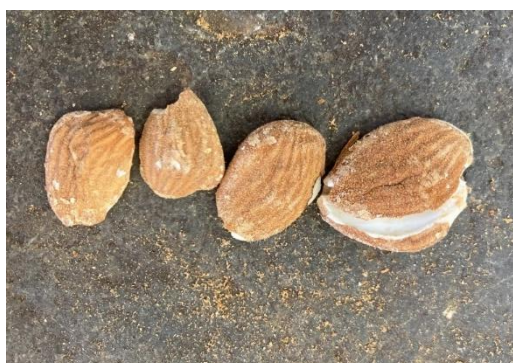
Defectos del grano.

Ejemplos de trozos. por defecto del grano o malas prácticas y por el generado en el escandallo: