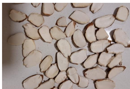
Defectos del grano.