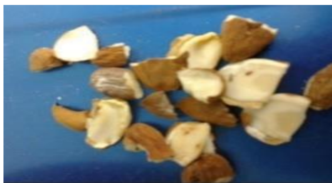
Infestación por mala gestión de almacenaje

El trastorno del daño oculto aparentemente se inicia cuando los granos de la almendra se exponen a un ambiente cálido. Las condiciones favorables para el desarrollo de daños ocultos se producen cuando llueve durante la cosecha. Sin embargo, el daño oculto puede ocurrir en cualquier momento después de la cosecha si los granos están expuestos a un ambiente cálido y húmedo continuado.